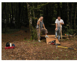
Le module de saut