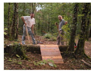
La reception du saut