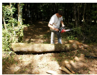
Préparation du module