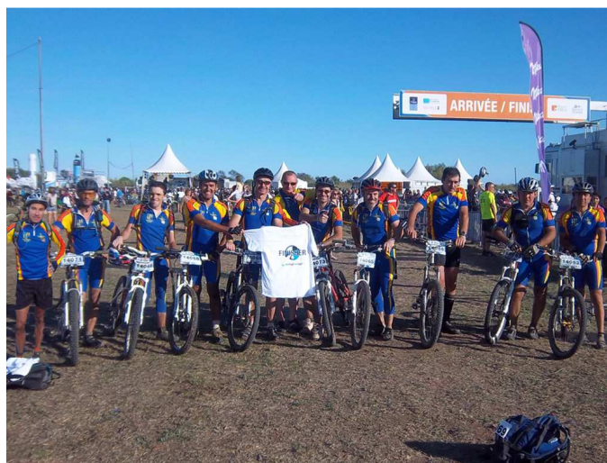
Les finisseurs après la course du samedi