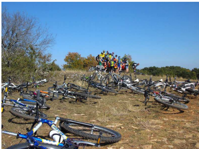
Voilà des VTT bien rangés au Dolmen de La Palein !